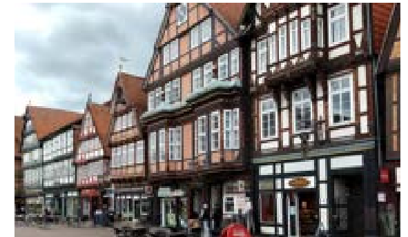
In der Celler Altstadt

Ca. 13.00 bis 18.00 Uhr / Fahrpreis: € 29,-