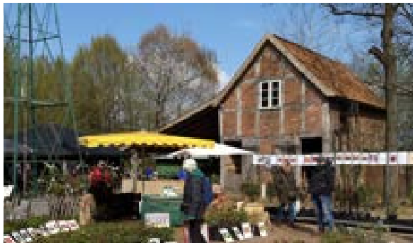
Im Freilichtmuseum am Kiekeberg

Ca. 12.30 bis 19.00 Uhr / € 38,- inklusive Eintritt