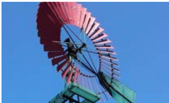
Historisches Windkraftwerk am Kiekeberg

Oldenstädter Straße 78 · 29525 Uelzen · Tel.: 05 81 / 97 97 0 (Präsenz im Büro: Montag bis Freitag von 9.00 bis 12.00 Uhr) info@uhlenkoepfer-reisen.de · www.uhlenkoepfer-reisen.de