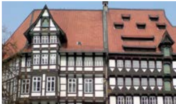
Am Braunschweiger Burgplatz

Ca. 12.45 bis 18.45 Uhr / Fahrpreis: € 35,-